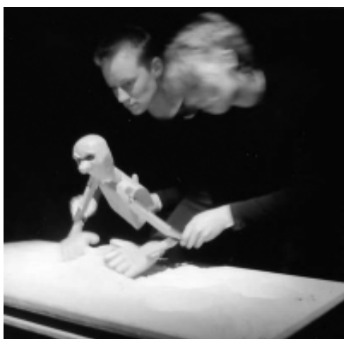
Masterclass van Het Firmament: '10 000 mijlen onderzee'.

Het Firmament vzw T.a.v. Willem Verheyden Minderbroedersgang 1-3 2800 Mechelen T. 015 20 33 65 E. contact@hetfirmament.be