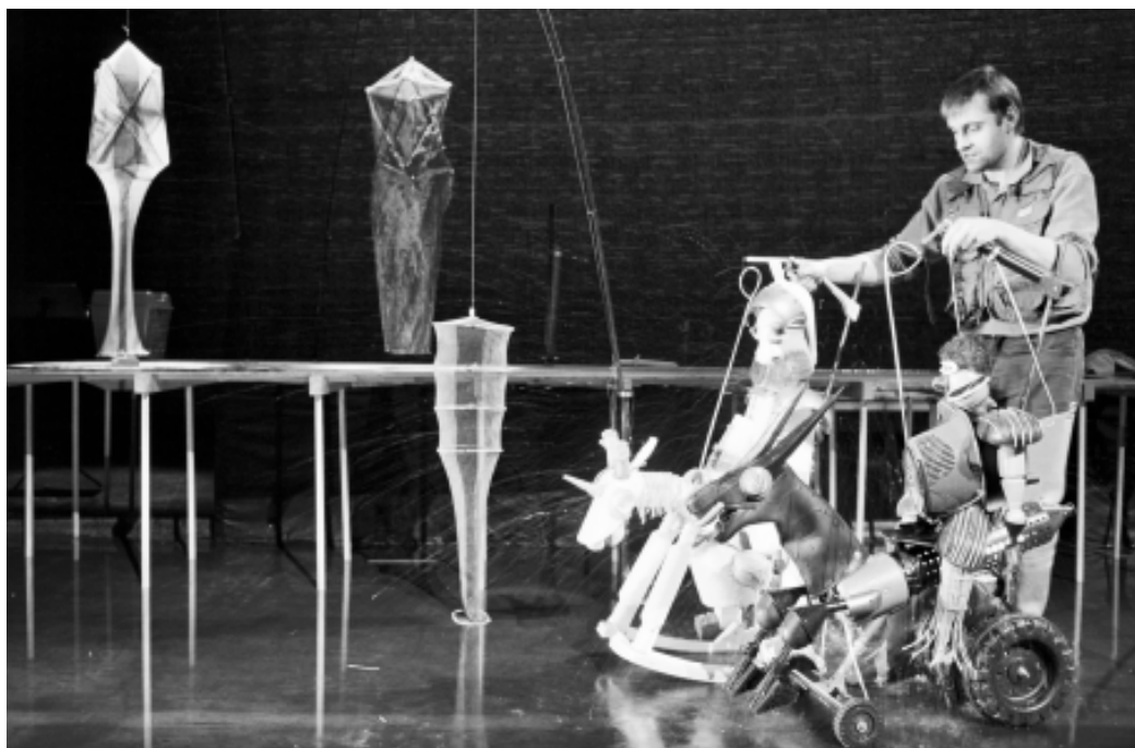
Muziektheater De Spiegel

ciale gebruiken, rituelen, festiviteiten, ambachten en traditionele kennis m.b.t. de natuur en het universum, die deel uitmaken van het culturele erfgoed van gemeenschappen en groepen, te beschermen.” Mede door deze internationale ontwikkelingen, kwam plots het figurentheater in Vlaanderen in het erfgoedvizier. Als medium maakt het immers gebruik van oude figuresystemen en voorwerpen, maar eveneens van speelwijzen, verhalen en heel specifieke (manipulatie-) technieken, die nooit of hoogst zelden zijn neergeschreven of op een andere manier zijn vastgelegd. De hedendaagse figurentheaterpraxis bestaat dan ook uit een voortdurend hergebruik van immateriële technieken en kennis, die mede door de inzet van onder meer nieuwe media tot erg verrassende resultaten leidt.